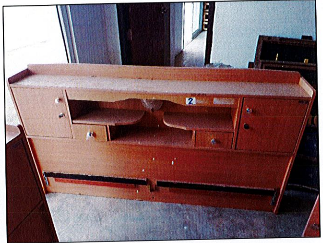
พัสดุรายการที่ ๒