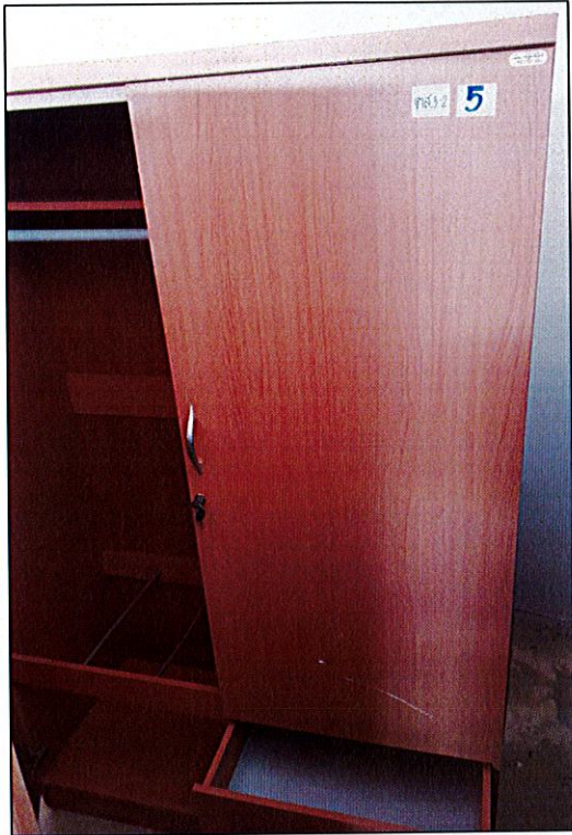
พัสดุรายการที่ ๕