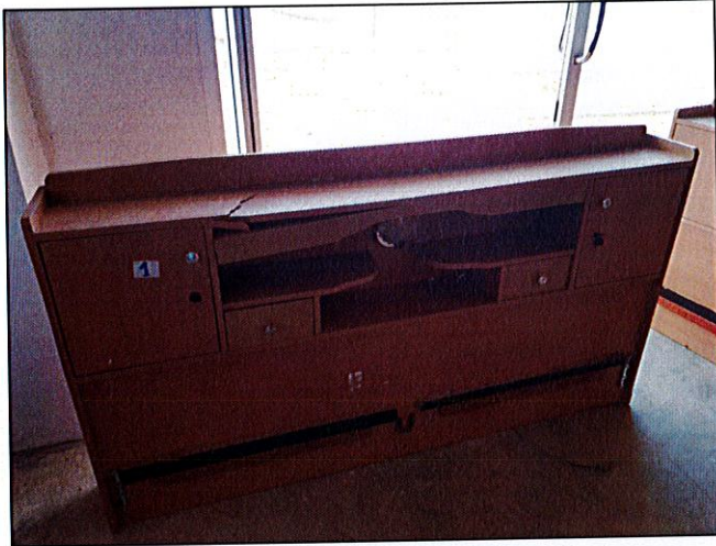
พัสดุรายการที่ ๑